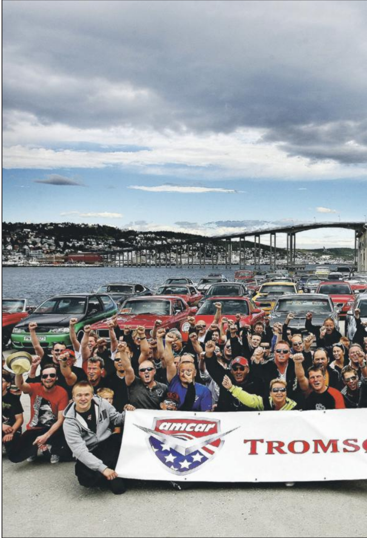
BILMILJØ: Motortidsskriftet BilSport arrangerte photoshoot på fergekaia i Tromsdalen. Her er alle