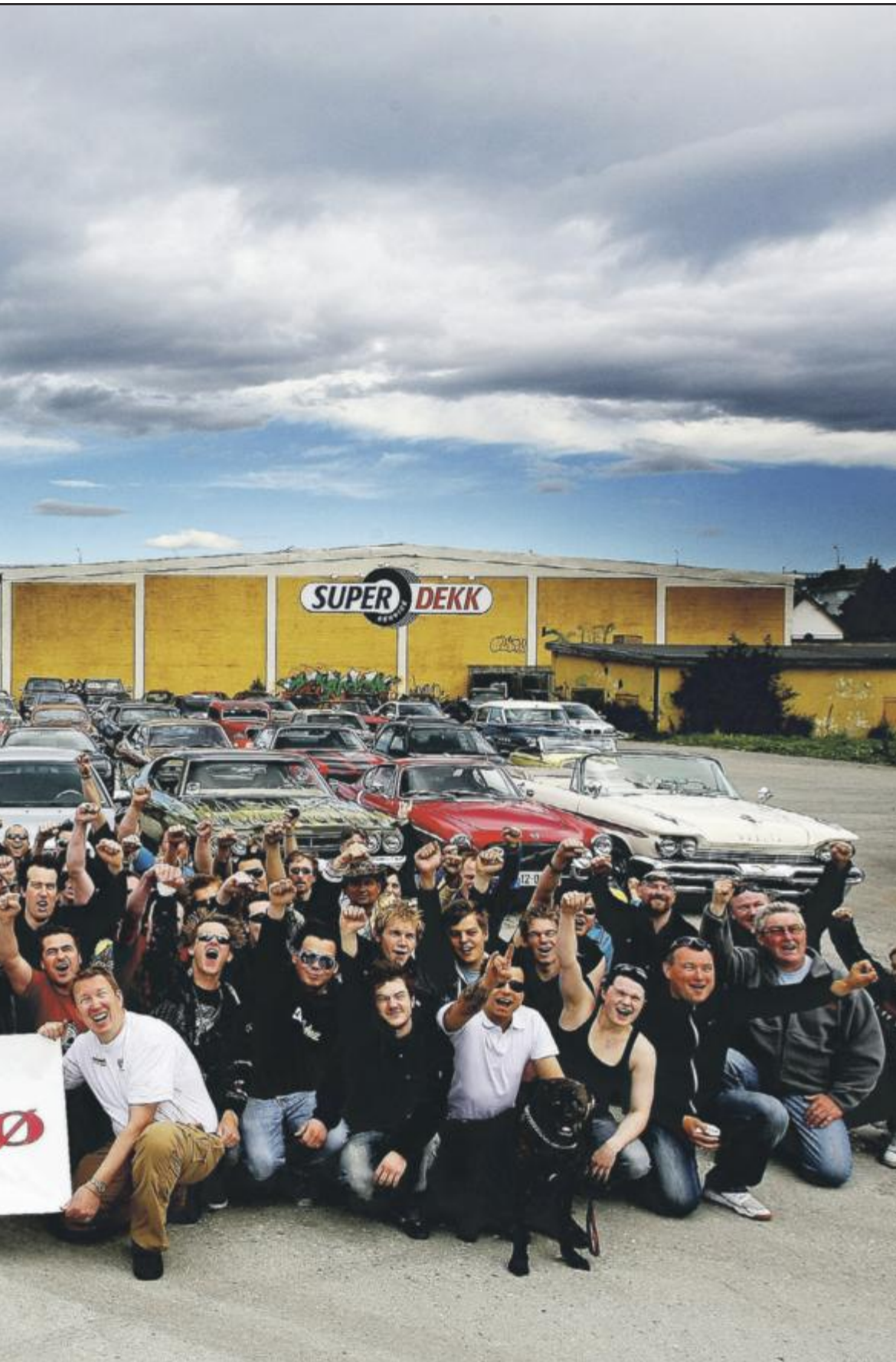
som møtte opp til bildet.

Telefon: 77 64 06 00 | epost: kultur@itromso.no SMS til 2242: BT <ditt tips> Maks 150 tegn. Tjenesten koster 5 kroner.