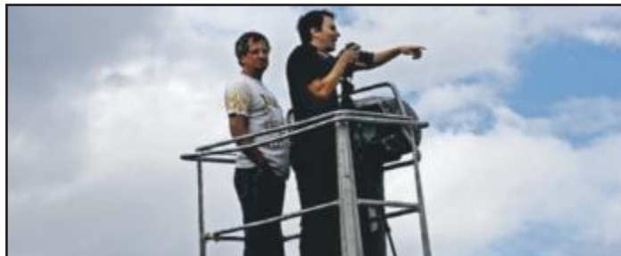
HØYT OPPE: Fotografen Mattias Larsson tok bildet av hele gjengen fra ei kran på kaia. Her instruerer han folket.